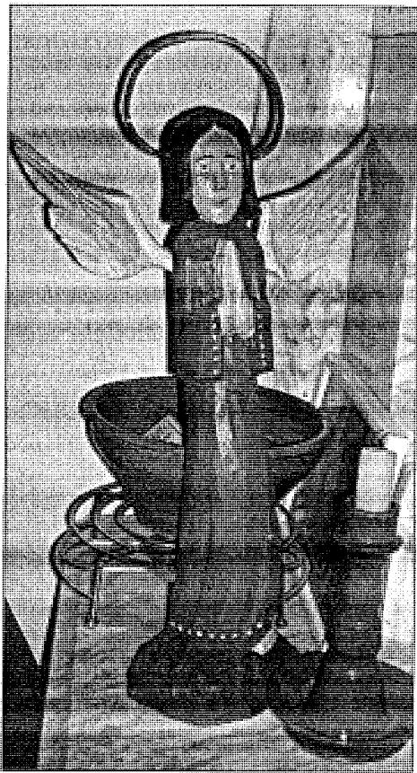
Ангелів народні умільці люблять виготовляти. Це божа справа.