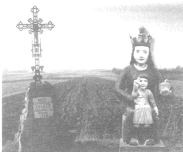
Drewniana rzeźba Matki Boskiej z Dzieciątkiem na tronie na tle fotografii z albumu „Kapliczki i krzyże znad Pilicy”

Polski w sztuce ludowej”. Tą wystawę odwiedził również Prymas Polski Kardynał Józef Glemp. Ruszyła działalność wystawiennicza z eksponatów własnych lub we współpracy z innymi muzeami regionalnymi. Sale wystawowe zostały otwarte również dla wystaw autorskich twórców ludowych lub naiwnych. Do dziś muzeum zorganizowało we własnym locum lub gościnnie ponad 40 wystaw. Trzy z nich powędrowały nawet do Francji, Niemiec i Ukrainę. Oprócz wspomnianej już wystawy „Historia i Wiara”, wymienił y kilka najciekawszych tytułów opierających się głównie na zbiorach własnych: „Ptaki i ptaszki w naturze, sztuce i tradycji ludowej”, „Szopki ludowe”, „Pasja Jezusa Krysta w malarstwie i rzeźbie ludowej”, „Judaica w polskiej sztuce ludowej i malarstwie nieprofesjonalnym”, „Koń etnograficzny i koń filatelistyczny”, „Patroni Europy w sztuce” (wystawa międzynarodowa) i towarzysząca jej wystawa ze zbiorów własnych – „Patroni i święci polscy. Madonny polskie”, „Polskie malarstwo na szkłe, dawne i współczesne”, „Cztery pory roku. Krajobraz. Praca. Obrzęd” (wystawa obrazów twórców ludowych z Polski, Białorusi, Jugosławii, Rosji i Ukrainy), „Polskie wycinanki