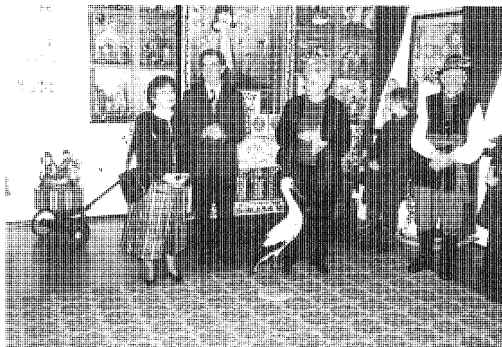
Na otwarciu wystawy w Muzeum Sztuki Ludowej w Otrębusach